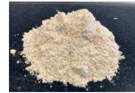
リン酸カルシウム