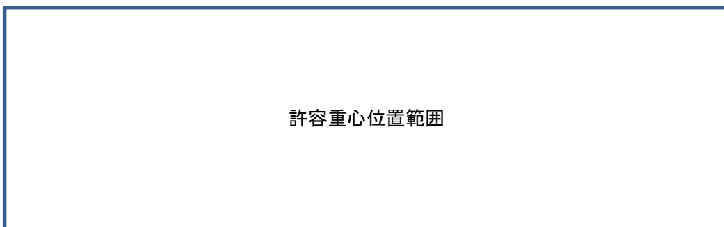
図〇 許容重心位置範囲