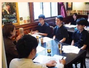
外国人材の様子 (研修時)

採用を進めるにあたっては、地元の大学や専門学校、日本語学校に出向き、担当教員と対話しながら、観光業や来訪者に「おもてなし」をすることに関心の高い人材を積極的に採用している。