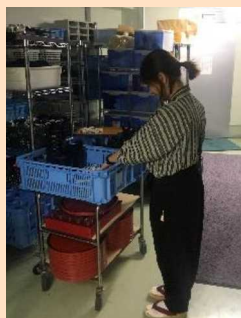
接客部で従事する外国人材

2019年、特定技能としてベトナム人材を1名採用し、給仕サービス中心に従事してもらっている。同じ国籍の方が口コミによるさらなる雇用促進効果が得られることや、雇用者コミュニティの基盤をつくりやすいことなどから、今後も国籍を絞りながら積極的に雇用を進めたい。