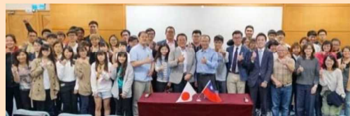
台湾の大学訪問時の様子

また、外国人材が就職した後も組合理事が定期的に各宿泊施設を訪問し、就業状況などを常に把握するようにしている。訪問時に課題が把握された場合は、理事及び宿泊事業者の代表者で構成する理事会と全体総会（年 2 回開催）で共有し、各施設が迅速な対応をしている。