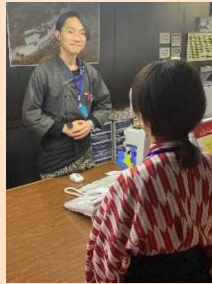
現場マニュアルをもとに指導を受ける外国人材 (写真奥)

初めて外国人材を迎え対応がぎこちなかった日本人スタッフも、彼らの一生懸命な姿に触発され、コミュニケーションが活性化するなど、相乗効果もみられる。さらに、継続的な外国人材の採用により、その後に入社する外国人材やインターンシップ生にとって、相談相手となる先輩がいることになり、安心して働ける職場環境が実現できている。