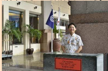
&lt;ホテルの「顔」として活躍する外国人材&gt;

2018年、接客能力の高さなどを評価して、外国人材3名を管理職に登用した。今後、外国人材のメンターとして、人材育成面で活躍することを期待している。