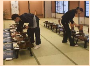
インターンシップ生（写真右）を指導する若手日本人スタッフ

若手の日本人スタッフは指導する立場となり、外国人材を丁寧に指導することで自身の業務スキルの向上にもつながっている。また、外国人材の真剣な姿勢に感化され、指導内容の意見交換などコミュニケーションの活性化にもつながり、さらなる成長が期待できる。