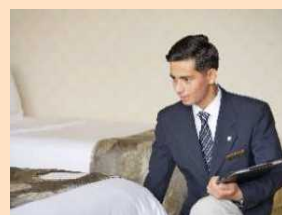
活躍する外国人材

生活支援として、母国語で会話可能な病院を紹介している。またメンタルケアの観点から、同じ国籍同士での交流会を開催しているほか、全社として隔年で、ダイバーシティフォーラムを開催し、各国の魅力についての紹介をフォーラム形式でプレゼン・共有し、相互理解を深める取組を継続的に実施している。