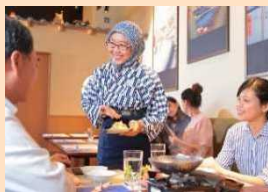
ハラルレストラン「和食 折紙浅草」で接客する外国人材

また、清掃分野では、契約社員が母国籍のパート・アルバイト社員に対し通訳を行い、フロア毎に国籍をまとめたマネジメントを実施する等、効率化を図っている。