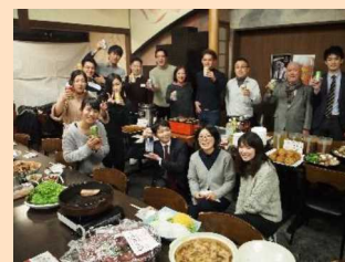
クラブ活動の様子

具体的には、社内や各施設内の人材交流を活発にするために自発的なクラブ活動を推進している。いつも一緒に仕事している仲間、普段は接しない従業員との交流がモチベーションとなり、外国人材に限らず、従業員の定着率の維持・向上にも寄与している。