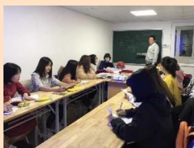
海外の大学での日本語教育の様子

海外渡航が難しい宿泊事業者の代理として組合理事が説明会を実施する場合もある。組合が人材募集も担うことで、組合員の負担軽減や外国人材の採用に寄与している。