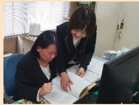
管理職として奮闘する外国人材（写真奥）と日本人スタッフ

現在では、インターンシップ生だった韓国からの外国人材が総務課主任として業務に従事している。毎年来日するインターンシップ生や、若手の日本人スタッフの頼れる相談役にもなっている。また、外国人材受入れの各種調整や書類作成なども担当し、欠かせない人材として成長している。