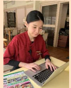
HPの翻訳に取組む外国人材

他方で、外国人利用者への対応が未着だった当社において、レストランをはじめとした館内の利用案内、ホームページの外国語対応(台湾語)を採用した外国人材に依頼した。その結果、海外からの問い合わせも増加し、利用者からは分かりやすい案内に対する評価も高い。また、対応した外国人材は、ホームページの翻訳業務を通じて、当社の歴史、日本の風習やマナーなども学ぶことができたとのことで、当初想定してなかった効果も感じている。