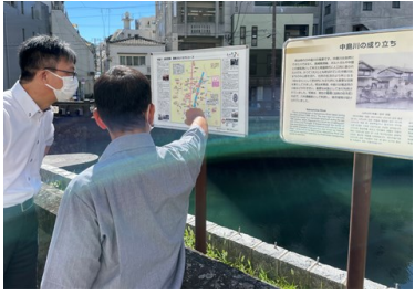
④専門家による現地調査