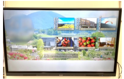
②デジタルサイネージの整備