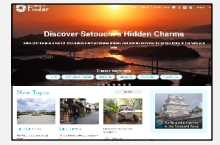
WEBを活用したエリア内の魅力発信

WEB・SNSを活用したエリア内のコンテンツの魅力等に関する効果的な情報発信を支援。