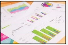
マーケティング調査

データに基づき、旅行者に対し訴求力のある取組を実施するための調査・戦略策定を支援。