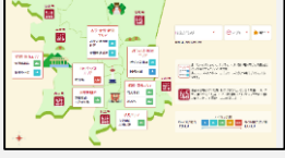
混雑状況の情報提供