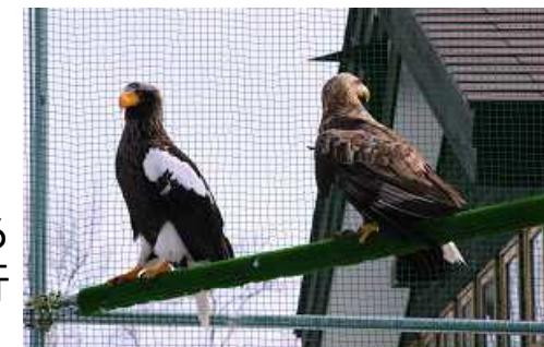
釧路湿原野生生物保護センターのオオワシ（左）とオジロワシ（右）