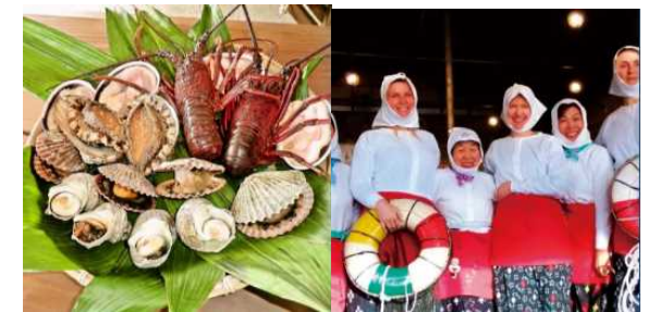
文化を伝えることによる高付加価値化（イメージ）