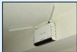
無料公衆無線LAN環境の整備