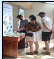
掲示物の多言語化