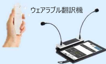
ウェアラブル翻訳機 対面翻訳機 等