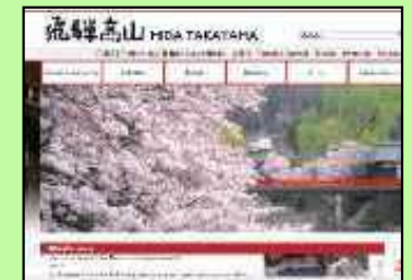
ホームページ (スマートフォン対応含)