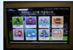
デジタルサイネージ