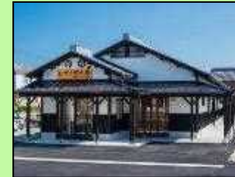
観光拠点情報・交流施設の 整備・改良等