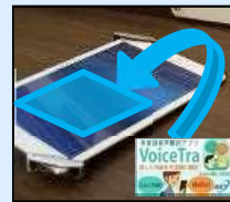
多言語案内・翻訳用タブレット端末