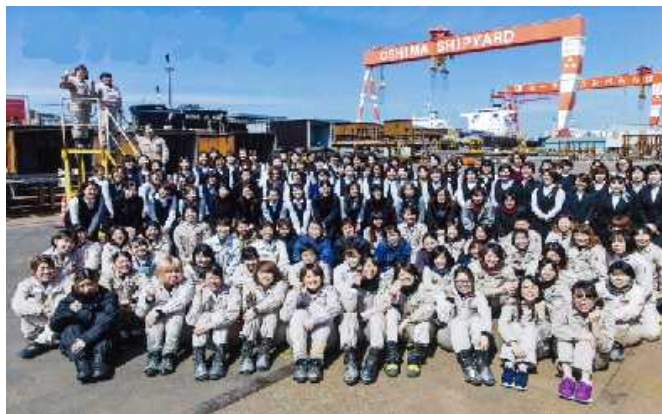
大島造船所及び関係会社・協力会社で働く女性社員の集合写真。「明るく、強く、面白く」をモットーにそれぞれの職場で活躍中