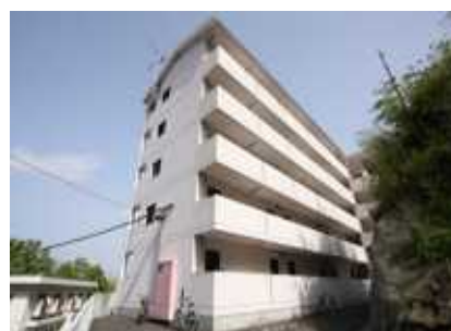
2007年に竣工した女性専用社宅。大島の高台にあり、バルコニーからは大島の街並みが一望できる。部屋はユニットバス+キッチン付の1ルームタイプ

大島造船所は1999年から毎年5名程度の女性技能職入社を目標に採用活動をしてきた。当初は3K（きつい・汚い・危険）のイメージが強く目標達成できなかったが、女性社員が働きやすい職場環境づくりや本人の希望を踏まえた配属等現場の努力、及びトイレ、休憩所、シャワー室の設置や女性専用社宅建設等福利厚生施設を充実させたことにより、2015年以降は女性技能職5名入社という目標を達成しており、現在35名以上の女性社員が現場で活躍している。女性技術職も2008年より毎年1名を目標に採用活動をしており、現在は5名が設計部や工作部のスタッフとして活躍している。これからも女性の活躍推進のため職場環境の改善と生活環境の整備に努め、積極的な採用活動を継続する。