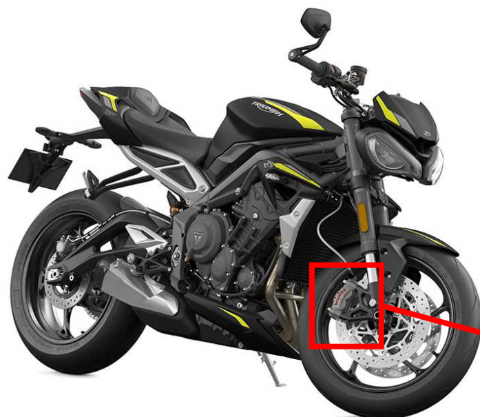
フロントブレーキキャリパー