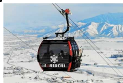
索道の再編や搬器の大型化・高速化により、混雑を改善し、快適性・満足度を向上