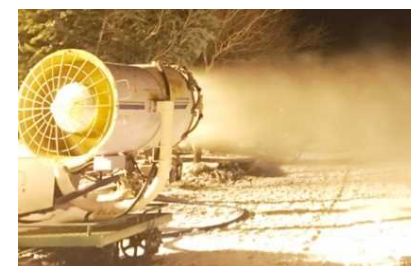
高機能な降雪機の導入により、営業期間を最大化・明確化