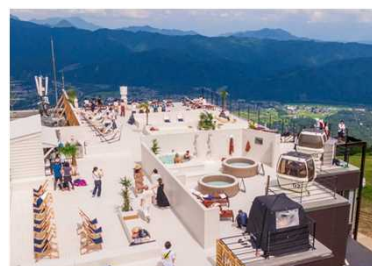
グリーンシーズンも楽しめる環境を整備し、通年での誘客を促進