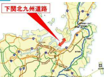
▲下関北九州道路のイメージ図

・下関北九州道路は、北九州市と下関市の都心部を結び、関門地域における既存道路ネットワークの課題の解消や関門トンネル・関門橋の代替性の確保、さらには循環型ネットワーク形成による関門地域の一体的発展を目的とした道路