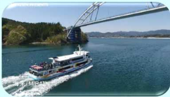
【5 大島】気仙沼ベイクルーズ(遊覧船)