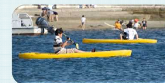
【11 日間賀島】キッズアドベンチャー