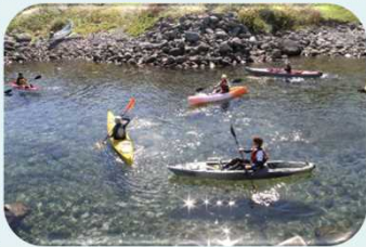
【2 天売島】シーカヤック体験