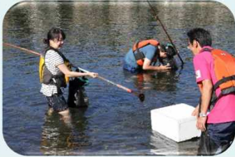
【2 天売島】ウニ採り体験