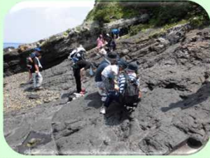
【22 甑島】化石体験イベント