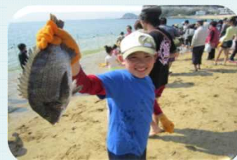
【12 篠島】夏休みイベント「魚のつかみどり」