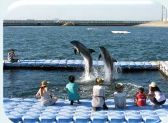
【11 日間賀島】日間賀島ドルフィンビーチ