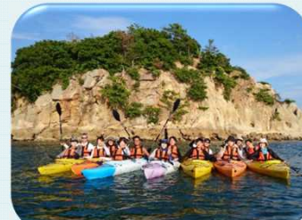
【17 小豆島】シーカヤック体験