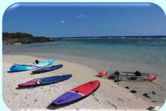
【24 徳之島】夏の短期留学2019 in 徳之島