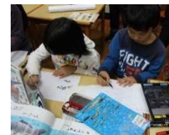
パッケージデザイン