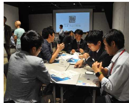
マッチング交流会（プロジェクトの具体化に向けた商談等）