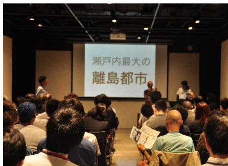
プレゼンテーション（連携のアイデアを発表）