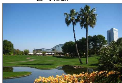
フローランテ宮崎(宮崎市)