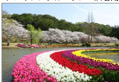
はままつフラワーパーク(浜松市)