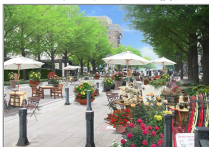
日本大通り(横浜市)