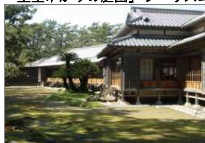
沼津御用邸記念公園(沼津市)