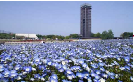
②浜名湖ガーデンパーク（浜松市）