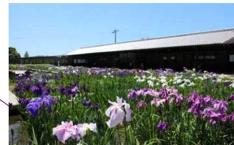
⑦加茂荘花鳥園（掛川市）