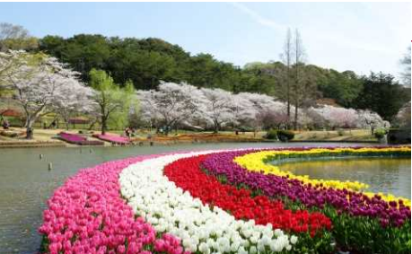
①はままつフラワーパーク（浜松市）