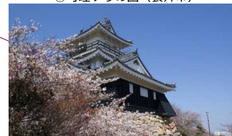
④浜松城公園（浜松市）