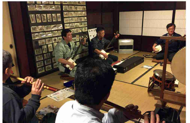
じょうはな庵での庵唄の練習の様子。東町庵も同じような使われ方をしている。