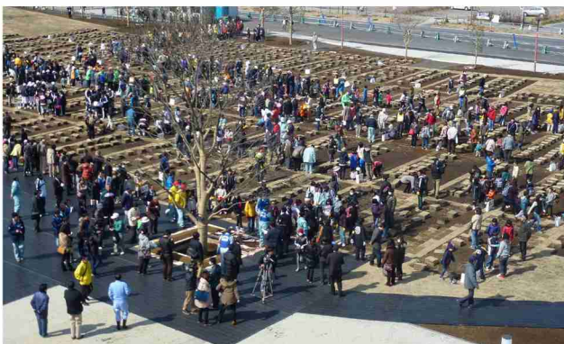
シンボルロード北側を市民2700名の参加による市民植樹祭。（平成25年3月）