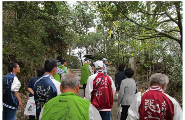
毎年視察研修を行い、景観まちづくりに活かしている。