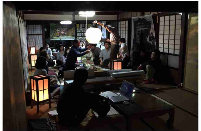
じょうはな庵において、曳山祭の室礼と都市空間の夜間景観に関するワークショップを行っている様子。