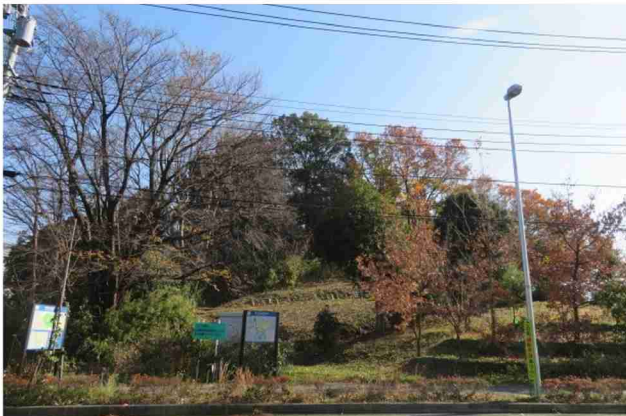
里山の保全・継承・発展を目指すため、地区の約1/4を公園緑地として緑化し、「保存の緑」「復元の緑」「修景の緑」として位置づけられた緑を配置。

結果として、計画地の約25%が公共と民間による緑地になり、10年以上が経過しても非常に維持管理の行き届いた美しい里山と住宅地が一体になって美しい景観を維持している。特に、里山保全のみならず、ポット苗15000本による復元の緑の試みや鎮守の森と一体として公園を計画するなど、特色ある計画を実践してきた。また、公共用地の中で、協働で緑化を行った「四季の花プロジェクト」など、官民一体となった活動が高く評価された。(池邊)