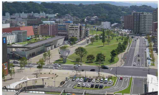
大分駅から南側上野丘・都心の森方面を望む。JR大分駅と上野丘・都心の森（写真上）を結ぶ大分駅上野丘線を「緑の景観軸」と位置づけ、「大分いこいの道」として整備され、東側には、複合文化交流施設「ホルトホール大分」が建設されている。

大分駅南地区は全国で展開された駅隣接の国鉄跡地開発の一つであり、連続立体交差事業を伴っている。その整備された駅南側に出てみる。なんとという空間であろうか。大分市の中心駅を出たところに広大な市民のための自由な空間が広がっている。お邪魔したのは2月の晴れの日。お昼頃は幼児を連れのお母さんやビジネスマン風の人、夕方になると高校生が思い思いの使い方をしている。都市景観とは目に見える都市の姿のことだと思うのであるが、この地区はそれ以前に、土地区画整理事業において本当に頑張っていて、幅100mの公共空間を捻出した。歩行者が寛げるような設計レベルの取り組みも見事であるが、この新しく創出された広大な空間は未来永劫残る。接する建物の形態コントロール、一体となって機能する複合的な公共施設の同時整備、市民による空間管理など、一通りすべきことも整っている。この空間づくりは長い時間の中で多くの人に関わった成果であると思うのだが、応募の中でその方達が見えない。この賞はそれら全ての人を表彰するものである。（高見）