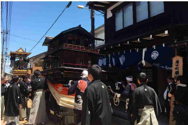
再生後の東町庵で庵唄の所望が行われる様子。