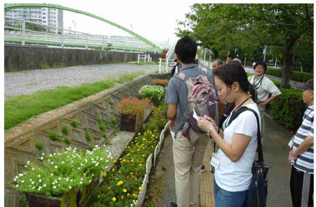
境川景観資源探しにて中央歩道橋から河口の高洲海浜公園まで、境川の上下流を右岸・左岸をジグザグに見て歩く。