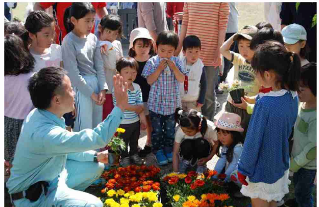
(株)スピナによる公園での花植イベントの様子。