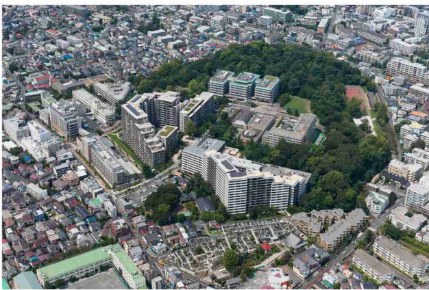
当地区は、中野区北端、練馬区との区境に位置し、江古田の森公園に隣接している。リング状の緑地帯が形成されている。

当地区は住宅密集地が広がる江古田にリング状の特徴的な緑地帯と連携し、土地交換の手法で誕生した都市再生プロジェクトである。開発コンセプトに掲げた「多世代により育まれる持続可能な地域」を旗印に、自然や緑の継承、多様なコミュニティの実現、健康・医療の幅広い取り組みがまちづくりの大きな柱となっている。住宅は分譲と賃貸からなり幅広い世代や学生、医療従事者など様々な住まい方に対応した構成となっている。小児緊急医療に特化した病院及び付属施設など地域への貢献度も高い。従前の地形や既存種を大切にしながら整備指針は250本以上の緑の保存、移植につながり、この地区ならではの景観が実現している。企画、情報発信、管理運営などのエリアマネジメントの中心も充実しているようだ。中心に位置するリブインラボとゆりの木広場は地区内外の人たちの活動拠点として大きな役割を果たしている。豊かな緑と佇まいのよい建築は勿論のこと、場の活力や住民の交流を育むマネジメントも高く評価することができる。（富田）