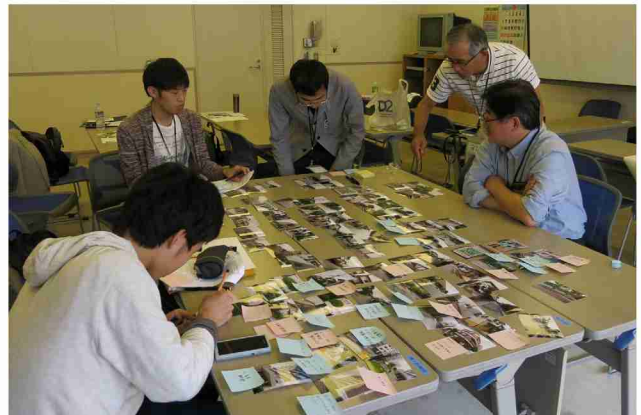
大学生新町中町まち歩きにて、まち歩きの写真を見ながら、良い景観と改善したい景観の写真を選び、街並み、建物、緑その他に大きく分類。