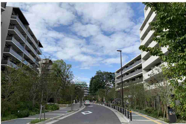
プロムナード。地区南側からの避難路としての役割も持つ。右側歩道（区道）と左側歩道状空地で舗装等設えを統一。