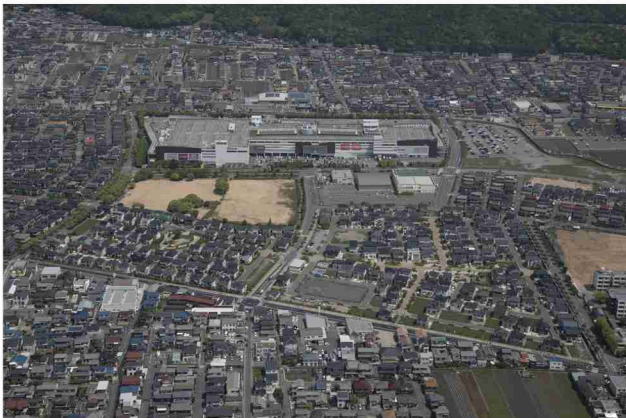
のぞみ野全景と周辺環境（平成29年撮影）。 一帯は企業社宅の跡地で、周辺環境や既存施設とのつながりを考慮。

新日鉄広畑製鉄所の社宅跡地を利用した戸建住宅の土地分譲開発の事例である。優れた景観を実現するために、地区計画、景観協定、景観形成指針等詳細のまちづくりルールを定めると共に、ルール運用のために管理組合と景観協定運営委員会を組成し、さらにコミュニティマネージャーを配置している点はすばらしい。建物の外構や道路緑化等のランドスケープに関しては、事業者を1社に限定することによって、秩序ある豊かな緑の空間を生み出しており、またその維持管理のために居住者に対する勉強会を定期的に開催している。一方建物に関しては、提携する11社の住宅建設会社が、景観協定を遵守しながらも会社独自の住宅デザインを提供することによって、土地購入者はオーダーメイドの住宅を建設することが可能となる。このような方式によって、景観協定がありながらも単調な町並みではなく、むしろ多様性を生みだそうとしている試みは高く評価できる。今後の景観の熟成に、おおいに期待をしたい。(卯月)