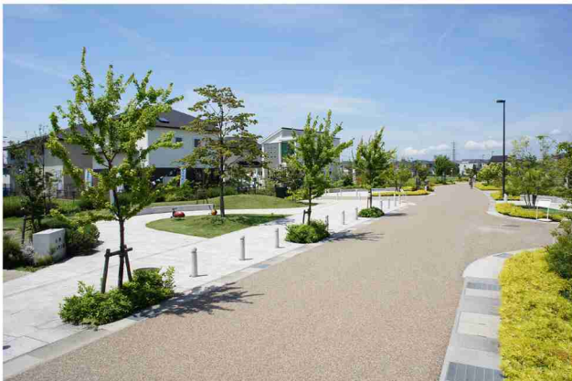
公園と道路の植栽。一体的にデザインされた開放的な空間。