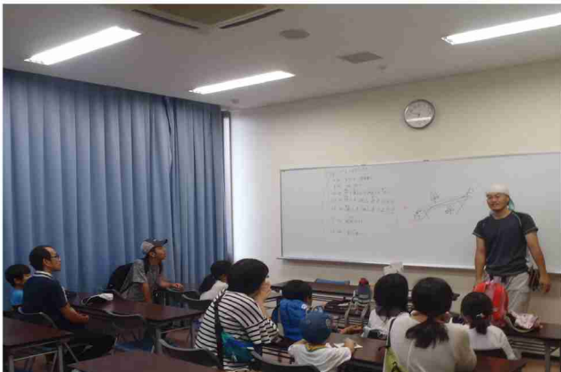
緑地の整備方針を地域住民や参加者と協議中。