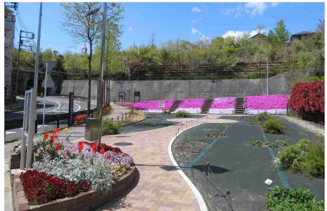
四季の花プロジェクト(万福寺さとやま公園)。