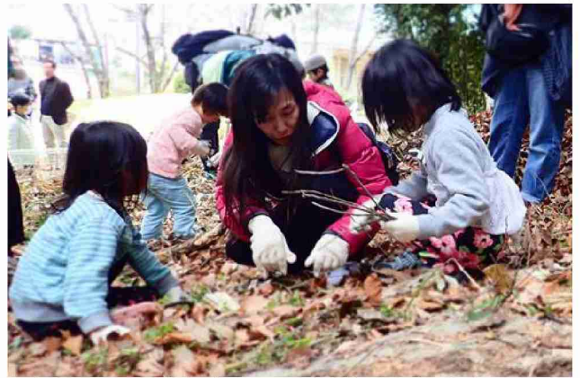
子どもたちは山での遊びを考えるなかで自主性と想像力を学ぶ。