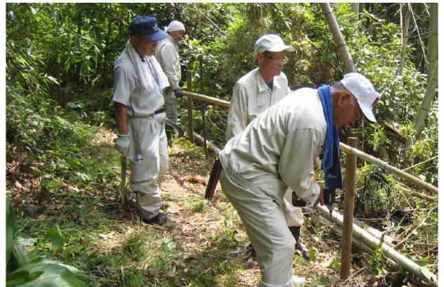
伐採した竹を、手すり造りに利用。