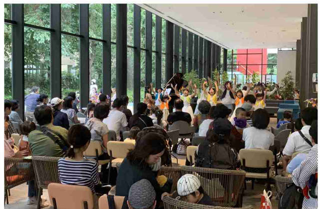
地元NPOの子どもたちを中心に、多世代の方の交流イベントとなったまちびらきイベント。