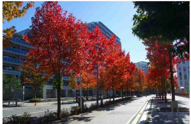
新百合ヶ丘駅(北口)から北上して、新百合山手地区への玄関口となる新百合山手中央通り。公共道路側の街路樹と合わせて片側2列植栽の紅葉。