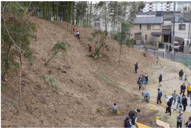
プレーパークとして利用されている緑地の風景。

URによって開発された香里団地の斜面緑地は、整備後50年が経過する中で、竹の侵食等により十分な管理が行われていなかった。そこで、子ども支援団体、野外活動団体、里山保全団体は、市、UR、市民活動支援センター、学生ボランティア等の多様な主体の協力と連携による実行委員会を組成し、里山を健全に維持管理する活動と共に、子どもが豊かな自然の中で遊ぶプレーパークを定期的に運営している。これまでのプレーパークは市街地内の公園等を利用するものが多かったが、この活動は、里山の保全とプレーパークを両立させる新しいプログラムとして高く評価できる。特に、比較的高齢者が有する里山保全の技術が、小さな子どもを持つ両親の世代や若い学生に伝承されていくことにより、活動の持続可能性が確保されている点も素晴らしい。今後、多世代の交流の場として、プレーパークの常設化を期待したい。(卯月)