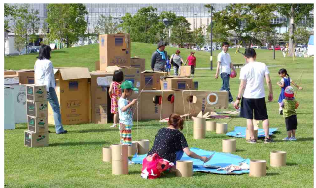
「大分いこいの道協議会」による活動として毎年行われる「大分いこいの道誕生祭」。