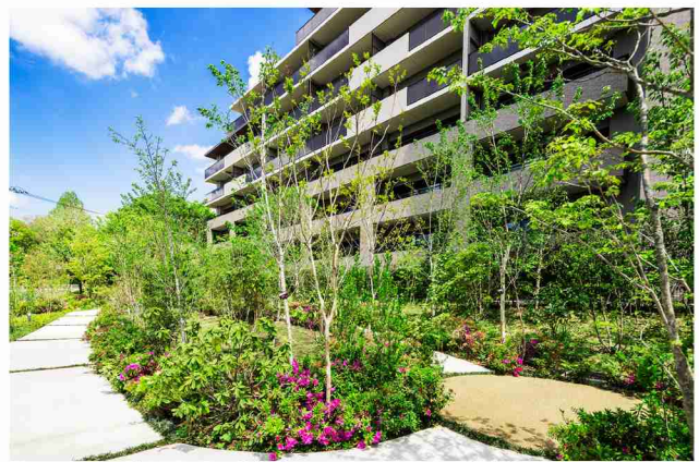
継承の丘。A街区西側の遊歩道。この地で育った既存樹や、多彩な緑を植栽。