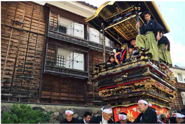
毎年5月に開催される城端曳山祭では、歴史的市街地を庵屋台と曳山が巡行し、風景を作り出している。

城端の取組は、その目的が交流人口の大幅な増加や観光振興ではないインナーブランディングである。地域を本気で守ろうとする仲間を増やし、その場所と活動を守ろうとする活動の本質は地域共有資産の維持と継承であると考えられる。曳山祭りは曳山や庵屋台の見事さだけでなく、町家を中心とした街並みを舞台に祭りが行われ、それを町の人々が支えてきたしくみまでを含めてユニークな価値がある。地域外から招聘された目利きの皆さんの発信が地域内外に城端の価値を再認識させた点が江戸以来の文化交流を彷彿とさせる点や、中心的な場となる町家をコアメンバーがかなりの金額を出資して購入・維持管理し、流行のクラウドファンディングとは異なる「顔の見える人たちが本気で守る」姿勢が大変印象的である。強力な担い手と支援者によってこの貴重な文化が継承されていくことを願ってやまない。(福井)