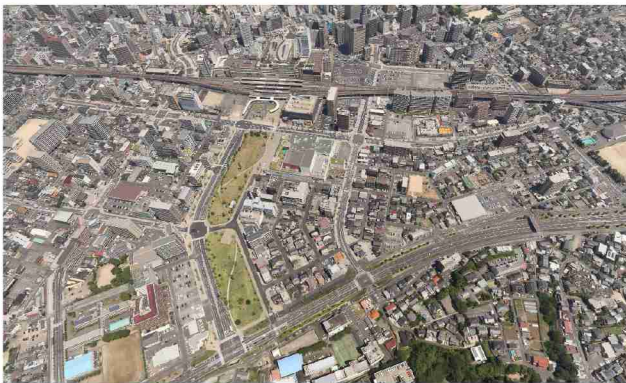
当地区は、大分市の中心市街地で大分駅（写真上）の南側に位置する。当地区の南側に位置する上野丘・都心の森（写真下）とJR大分駅を結ぶ大分駅上野丘線を「緑の景観軸」と位置づけし、多目的広場や緑地として整備を図った。

シンボルロード「大分いこいの道」では、市民ボランティアで組織された「大分いこいの道協議会」が設立され、整備後の芝刈りや清掃活動等の維持管理や広場利用の啓発、賑わい創出のイベントの開催など地区の景観保全や賑わい創出に取組んでいる。