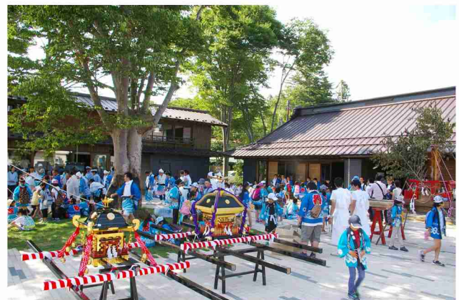
北側広場はプレオープンの直後から御神輿で利用されている。