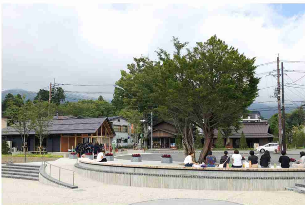
富士見テラスでバスを待つ人々。奥には待合所、交差点、北側古民家が見える。

都市景観大賞は、対象空間と周辺施設が一体となって良質な景観が形成されていることが要件とされる。従って、単独の公共施設類は対象とはならない。だが、過去にも単独施設と見なされる応募が少なからずあり、審査会において問題となってきた。当地区も、面積が0.64haと狭小であり議論となった。しかし、これは山中湖湖畔に点在する景観事業の先導的役割を果たすものであり、地域の既存建築物を丁寧に保全再生しつつ、新たなコミュニティ拠点を創出することに成功している。そして何よりも、地元住民の間にあった景観事業に対する懸念を払拭し、「やれば出来る」という意識改革を図ったことは特筆に値する。現在、当地区の成功を見て山中湖村の他地区においても、良質な景観形成への機運が高まっている。このような、地域全体の景観形成事業に対する理解を深めたパイロットプロジェクトであることを評価し、本事業を特別賞として選定することとした。(田中)