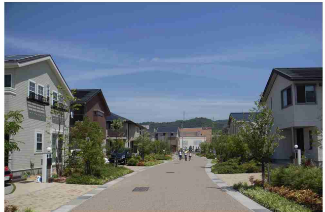
コミュニティ道路と遠景の京見山。 主要な道路はまちなみ景観の軸としてコミュニティ道路で整備。