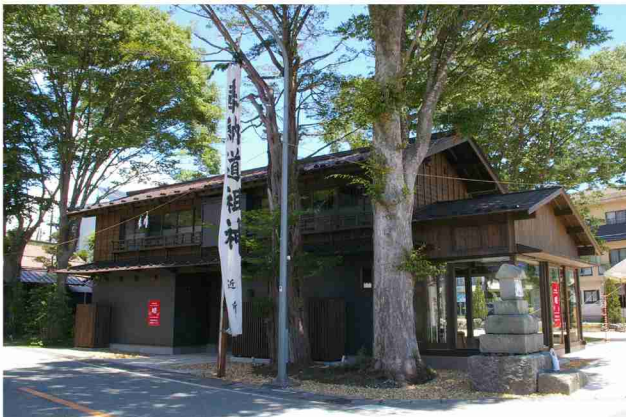
交差点の道祖神や既存樹を残しながら古民家を改修。