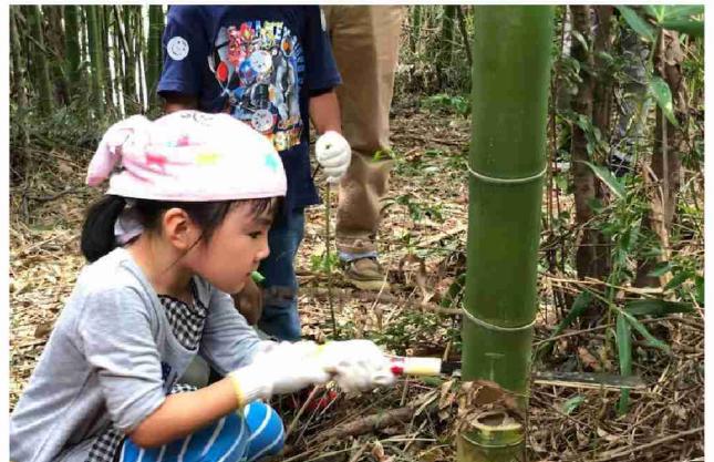
ノコギリの使い方を真剣に教わるこどもたち。