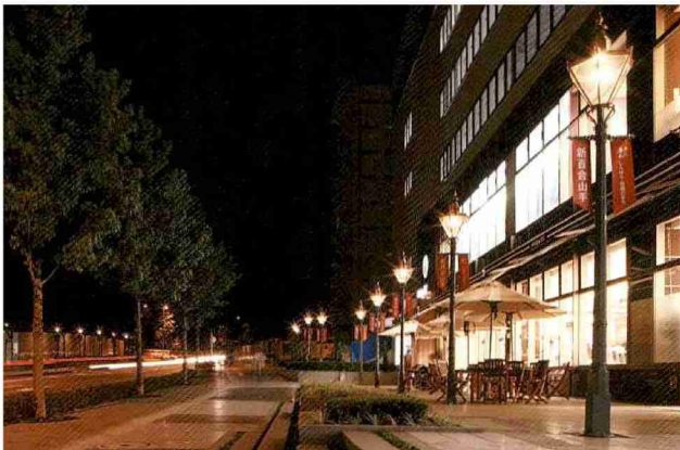
新百合山手中央通りは、壁面後退の民地部の空間にイメージを高めるガス燈25基を設置。