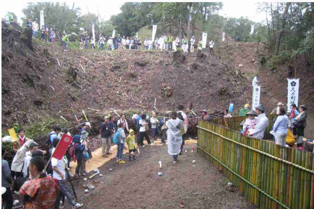
山城に行こう2016にて、枡形虎口による防御を模擬体験。