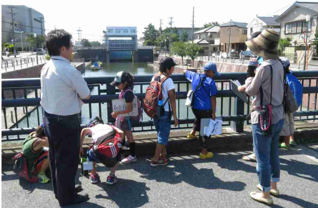
子どもまち探検隊にて、子ども達が境川沿いの元町を歩いて昔の浦安から、残したいものや、おもしろいものを探した。

自治体において景観行政を実効的かつ継続的に行うには、景観行政に対する住民の支持と専門性との継続的なパートナーシップの構築が重要である。浦安市ではそれが高い水準で実現している。デザインレベルの高い住宅地である中町・新町を中心に、浦安を選び、浦安に思い入れのある専門的知識を持つ住民が活発に活動している。東日本大震災での地盤液状化被害や住宅地の敷地分割等による景観変化への危惧をきっかけに活動を展開し、まち歩き、広報活動、先進事例見学、表彰制度の実施など景観に関するフルメニューの活動に加え、町会単位の地域活動をつなぐなど、行政が準備した枠組みを住民自身が充実・発展させた自治的な景観まちづくりが進められている。地域の歴史的な文脈と景観資源・人的資源を十二分に活かしたこの活動がこれまで以上に多くの市民に浸透していくことを期待したい。(福井)