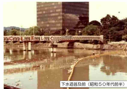
下水道普及前（昭和50年代前半）