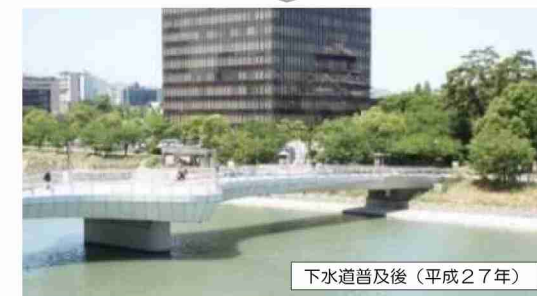
下水道普及後（平成27年）

汚水を適切に処理することで、 河川、海域等の水質を保全 。その便益は、不特定多数の人々に及ぶ。