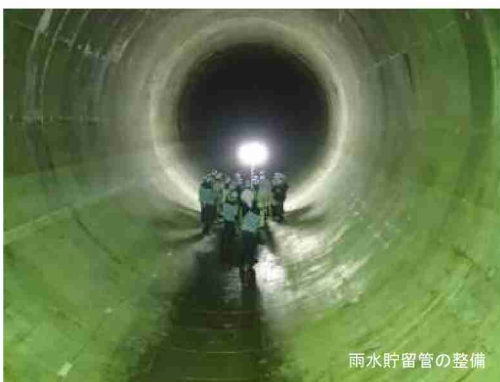
雨水貯留管の整備

都市に降った 雨の排除 により、 浸水被害を防除 。その便益は不特定多数の人々に及ぶ。