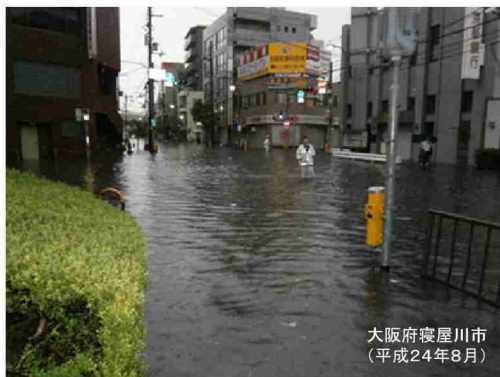
大阪府寝屋川市 (平成24年8月)