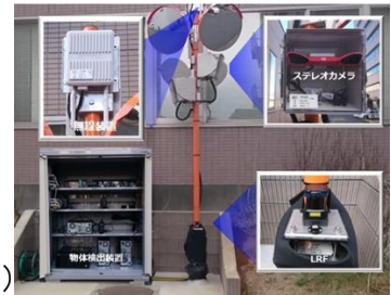
路車間協調の例