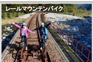
レールマウンテンバイク