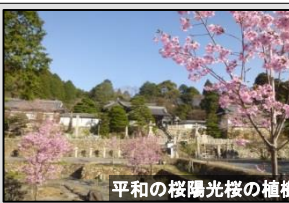
平和の桜陽光桜の植樹