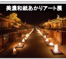
美濃和紙あかりアート展