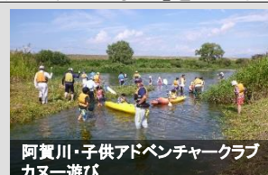
阿賀川・子供アドベンチャークラブ カヌー遊び