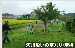
河川沿いの草刈り・清掃