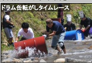
ドラム缶転がしタイムレース