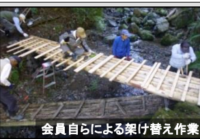
会員自らによる架け替え作業