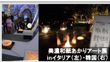
美濃和紙あかりアート展 inイタリア(左)・韓国(右)