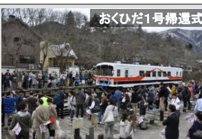
おくひだ1号帰還式