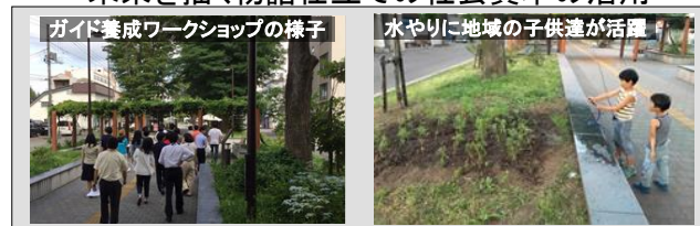
ガイド養成ワークショップの様子