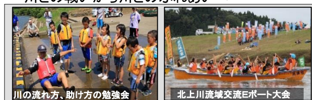
川の流れ方、助け方の勉強会