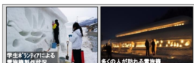
学生ボランティアによる雪旅籠製作状況