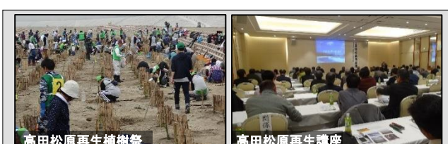
高田松原再生植樹祭