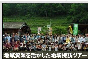
地域資源を活かした地域探訪ツアー