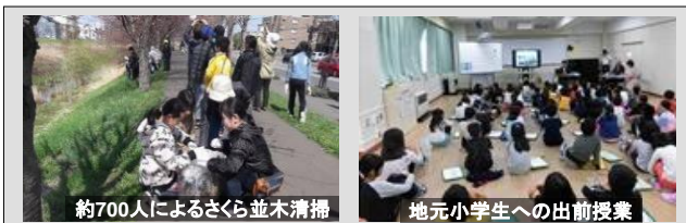
約700人によるさくら並木清掃