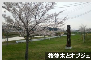
桜並木とオブジェ