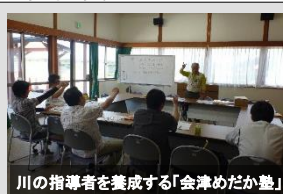
川の指導者を養成する「会津めだか塾」