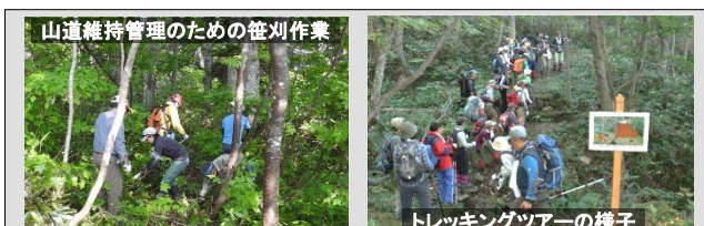
山道維持管理のための笹刈作業