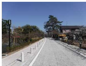
乙川プロムナード(堤防道路)

籠田町線道路再構築整備 道路幅を減らし(10m⇒6.5m)、歩行者を通す緑道幅を増やす(10m⇒17m)。