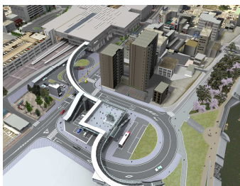
東岡崎駅前ペDESTリアンデッキ整備