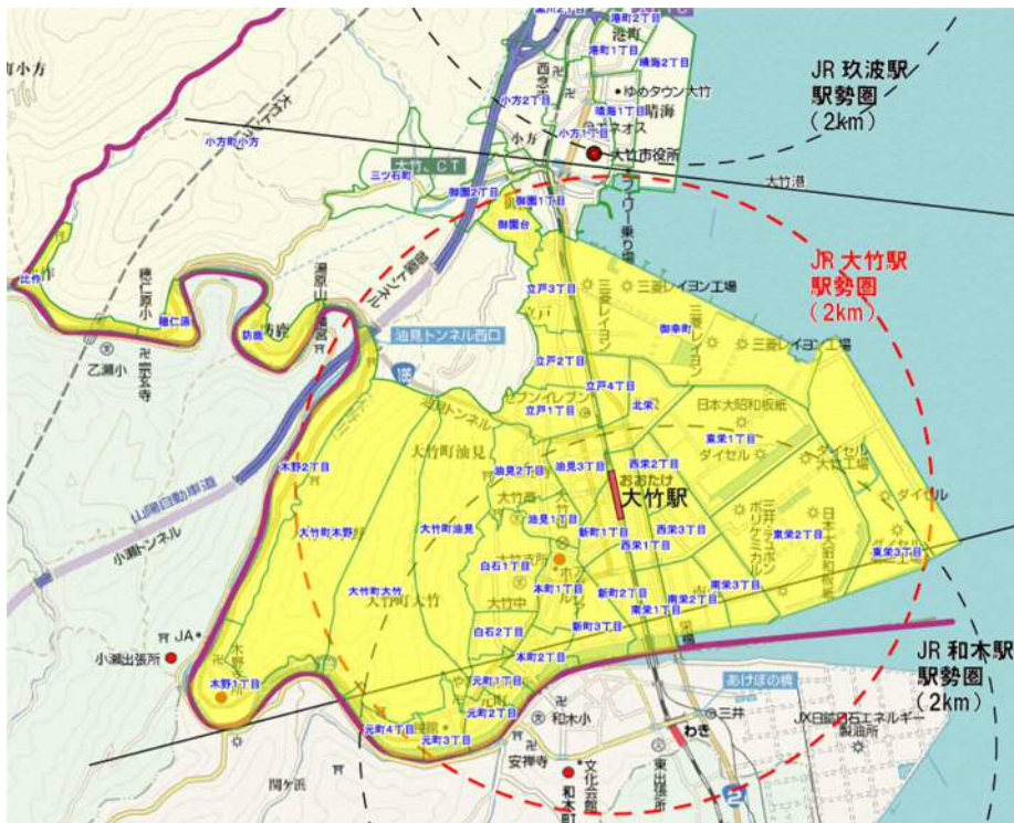
図 大竹駅の駅勢圏