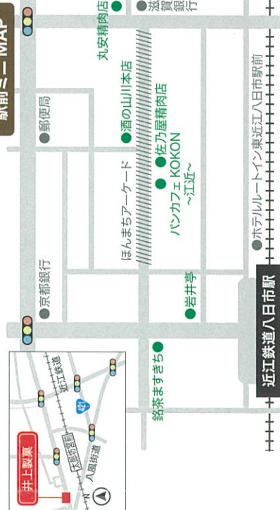
BANCAFE KOKON ~江近~

創業1933年。太郎坊宮の門前で伝統の和菓子と手づくりケーキを製造直売。お土産、ご運物にとろろ。