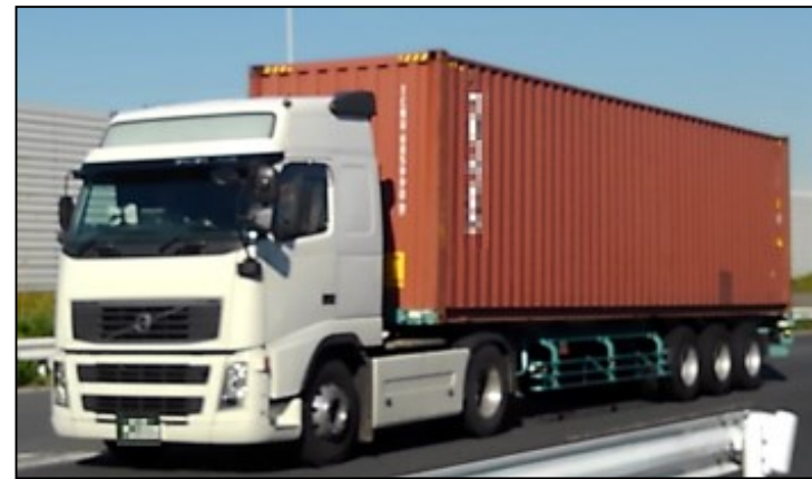
国際海上コンテナ車(40ft背高)