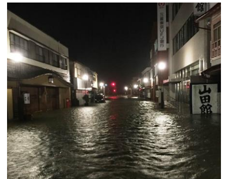
伊勢神宮外宮前の浸水状況(三重県)

※1 水害被害額の算出に当たって使用する係数（都道府県別家屋1㎡当たり評価額等）の平成29年単価の設定や都道府県からの報告内容の更なる精査等を行い、平成30年度末頃に最終的な取りまとめ結果を公表する予定です。