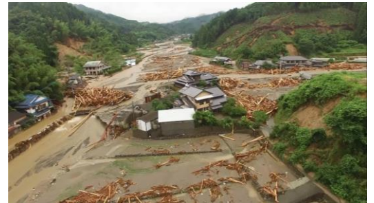
赤谷川の土砂・流木被害(福岡県)