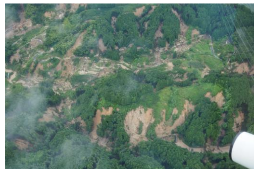
同時多発的な斜面崩壊（筑後川水系北川）