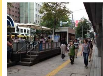
オープンカフェ等の施設の整備等によるまちの賑わい、交流の場の創出(イメージ)