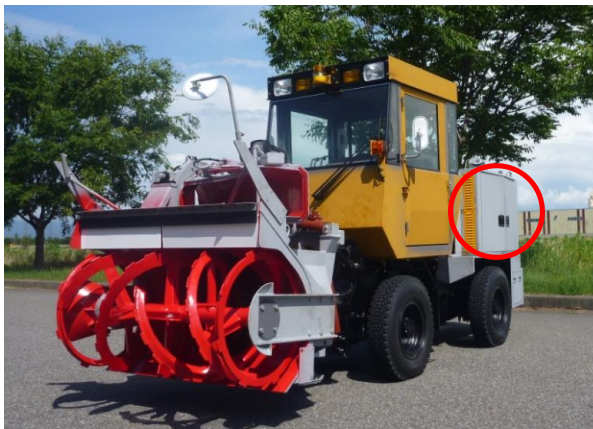
「ニイガタNR83ロータリ除雪車」