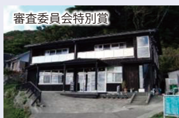
審査委員会特別賞

人口10万人のむらを目指す、たかが 100人、されど100人のむらづくり物語 (徳島県海部郡美波町)