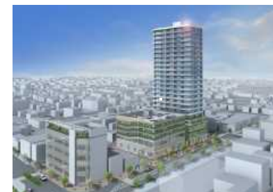
駅前一丁目6街区市街地再開発事業