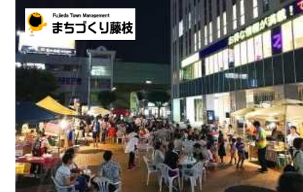
駅周辺広場・道路空間賑わい創出事業