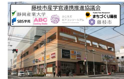
産学官連携情報ビジネス創造事業