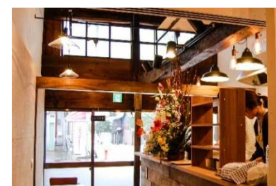
起業支援・移住促進・エリアの価値向上等のため、リノベーションをテーマとしたワークショップ等(城下町高田リノベーションまちづくり事業)