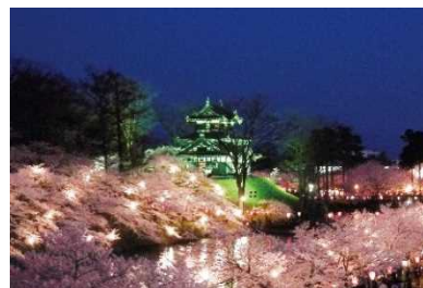
高田公園整備事業 (高田城跡)