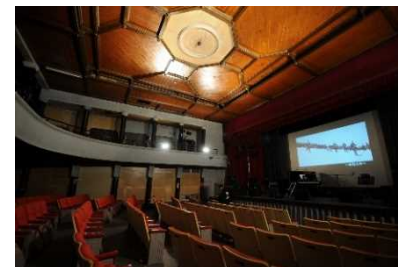
「100年映画館のあるまち」誘客・回遊強化 (高田世界館)