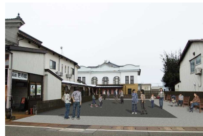
100年映画館周辺交流広場整備