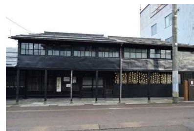
旧今井染物屋(100年町家)体験・交流拠点整備