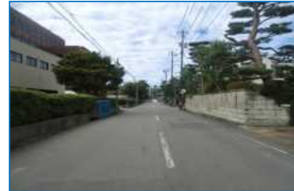
歴史的市街地の景観整備（無電柱化）