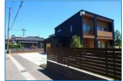
ランド・バンク事業による狭隘道路の解消等で、良好な居住環境を創出し中心部の人口密度を維持