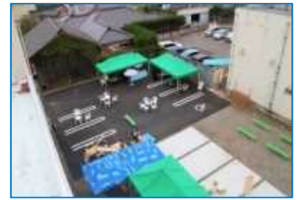
公共空間等をイベント等で有効的に活用し、魅力ある「若者が集まるまちなか」を創出