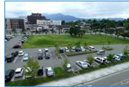
駅と中心部を結ぶバスハブ整備により、交流人口を拡大するネットワークを形成