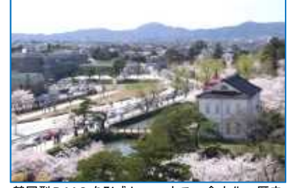
鶴岡型DMOを形成し、ユネスコ食文化、歴史的資源の魅力発信による、まちなか観光を推進