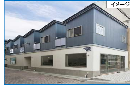
まちなか居住拠点整備事業（銀座地区） （優良建築物等整備事業）