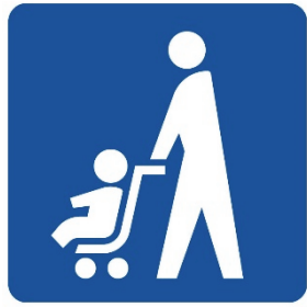
ベビーカーマーク

ベビーカー使用者が安心して利用できる場所や設備（エレベーター、鉄道やバスの車両スペース等）を表しています。