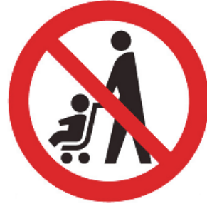
ベビーカー使用禁止マーク

ベビーカー使用者が安心して利用できる場所や設備（エレベーター、鉄道やバスの車両スペース等）を表しています。