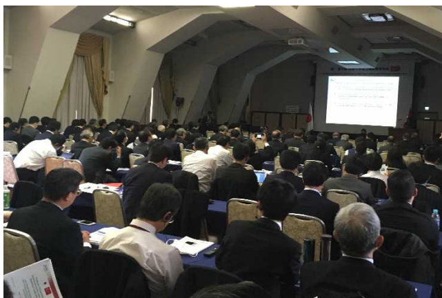
○ 両国民間企業による会社紹介