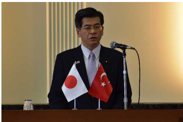
○ 石井大臣による開会挨拶