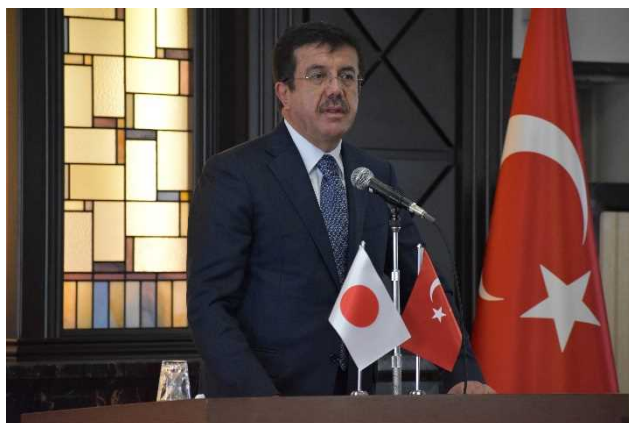
○ゼイベクジ経済大臣による開会挨拶