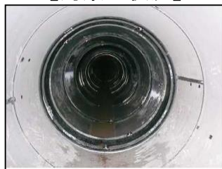
内面バンド設置状況