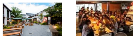
* 長野市「パティオ大門」