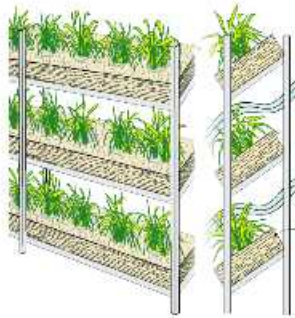
透過型壁面緑化（多段積層型）イメージ

ワイヤーやメッシュなど、または、多段積層型など、壁面の向こう側が見通せる緑化壁を創出する技術です。