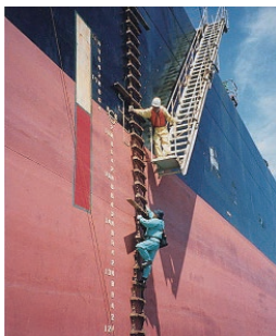
大型船へ乗船。乗船するときは縄梯子や可動式の階段を使うので細心の注意が必要!

「水先人」とは、航行が難しい水域や港湾を航行する船舶に乗り込んで、船舶を安全に目的地まで案内する、船長や航海士の頼もしいパートナーです。一言でいえば海上での案内人で、海の世界では「パイロット」と呼ばれています。「パイロット」と聞くと、多くの方が飛行機の操縦士を思い起こすかもしれませんが、実は「パイロット」の語源は、この「水先人」からきています。 船舶を安全に目的地まで案内する重要な任務だけに、水先人の免許を取得するには、必要な乗船経験と3級海技士（航海）以上の海技免許があること、登録水先人養成施設の課程を修了すること、水先人試験に合格することが求められます。免許は1〜3級の3種類と自分が担当する区域（水先区）ごとに分かれています。どんな大きな船でも案内できる1級水先人の免許を取得するには、船長を2年以上