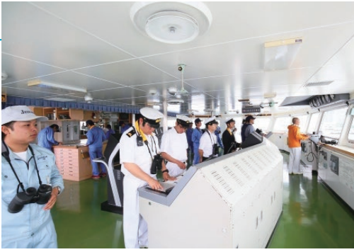
独立行政法人海技教育機構の練習船「銀河丸」ブリッジにおける航海科実習生の実習風景