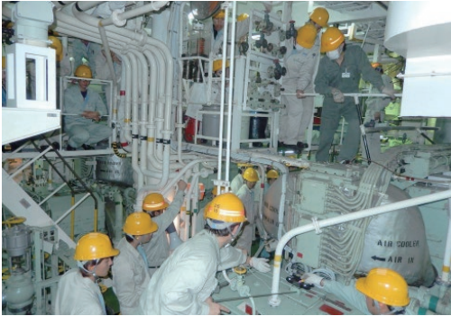
独立行政法人海技教育機構の練習船「日本丸」エンジンルームにおける機関科実習生の実習風景