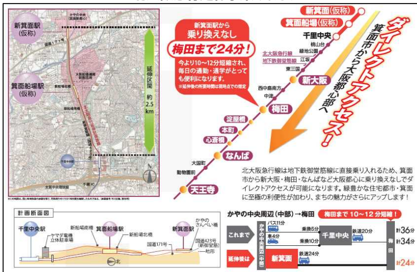
北大阪急行延伸事業の概要