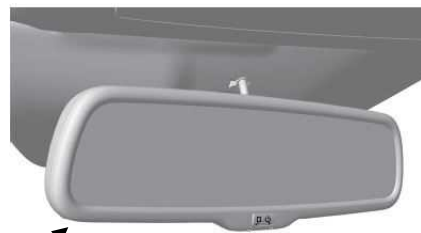
自動防眩ルームミラー