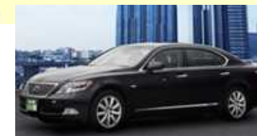
ハイヤーサービス