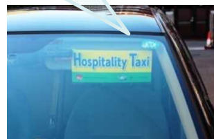
外国語対応タクシー