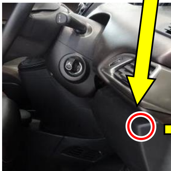
基準不適合発生箇所