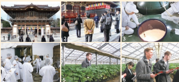
①②千年以上の歴史をもつ成田山新勝寺を参拝。③④滝沢本店にて日本酒の製造工程を見学。試飲も。⑤⑥熱田農園ではイチゴ狩りを体験