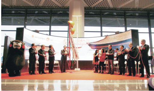
2014年12月22日のセレモニーの様子 (成田国際空港)

2014年、訪日外国人旅行者数が1341万人を達成しました! 観光庁は、2020年までに訪日外国人旅行者数2000万人の達成を目指していきます。