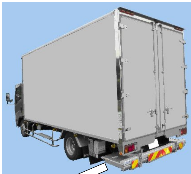
テールゲートリフト装置