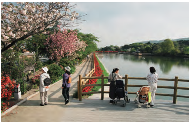
周辺の高度規制や用途指定により、開放感のある景観が生まれている。遠景には西山連峰が見え、一瞥がりの景観をなす。