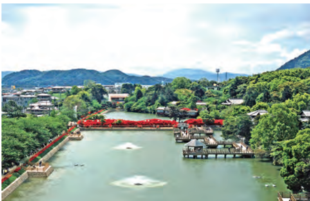
八条ヶ池周辺地区全景。水上橋・キリシマツツジ・老舗料亭・一般住宅などが公園と境内の木々の中に溶け込み、一帯で調和のとれた景観を成している。

この水景、緑景、生活景が一体となった景観は観光的価値を高めることにもつながっているようだ。また、四季を通じた様々な催しを行うことで広く市民に愛される場となっており、今後も市民交流の中心として多くを期待できる。現在、長岡京は京都や大阪のベッドタウンとして利便性の高い都市でありながら、歴史に育まれた景観を守り活用し、後世に受け継いでいこうとする官民の弛まぬ努力はそれによって創出される景観的価値とともに充分大賞に値する。(富田)