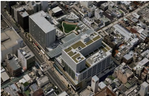
当地区は高松丸亀町商店街の国道 11 号線の玄関である。屋上庭園が整備され、環境に配慮した憩い空間を創出している。

高松の丸亀町は、いまや商店街再生の成功事例として全国に名が通っている。その名を聞いて人々が思い浮かべるのが、あのガラスのドームであろう。地方都市の商店街再生に成果を挙げている事例はもちろん全国にあるが、そのイメージは、店先の商品とともにほじける人々の笑顔、あるいはモニュメントであって、パースペクティブな眺めとして印象づけられ、差別化される事例は、そう多くないと思う。今回の受賞対象の G 街区は、かのドームのある通りの延長線上にある。このいかにも記号的呼び名は、丸亀町グリーンというビル名称に変化（へんげ）したが、丸いドームと対称的な、直線的でくっきりとしたファサードと屋根に光が充ちた半屋外のデザインとして、やはり視覚的に記憶されるに違いない。街路幅員（D）と建物高さ（H）の比、D/H とは、都市デザインの専門家にはなじみの指標だが、それを事業できっちり位置づける例は、まず聞かない。適度な囲われ感が出現している。いうまでもなくこの空間を実現することが目的ではなく、商いと暮らしの再生のための事業であり、そのための苦労は計り知れない。しかしそれをきちんと目に見える姿形で印象づけること。本賞に誠にふさわしい成果である。（佐々木）