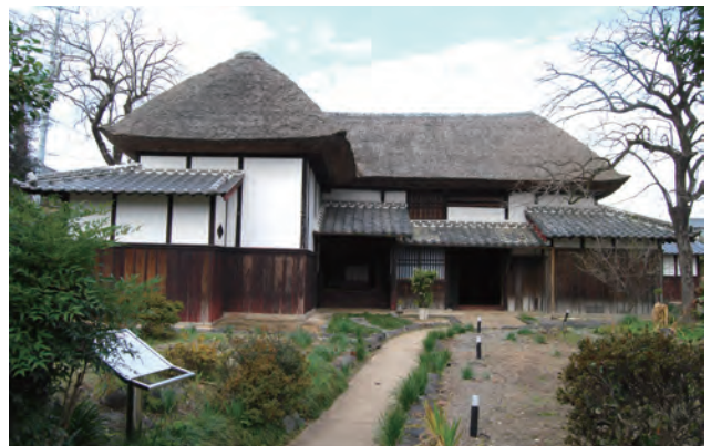
鹿島市指定文化財旧乗田家住宅。基本的には農家住宅であるが、武家の様式も持つ。当地区の半農半武士の生活様式を伺うことができる。