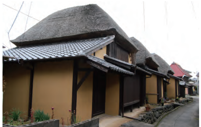
旧長崎街道から路地を入った奥にある茅葺町家群。伝建事業で、茅葺の 3 棟の修理を同時に行った。現在は、地区を訪れる人々に公開している。