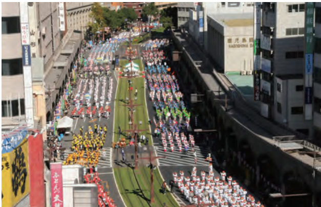
都市の中心部を带状に結ぶ緑の景観軸を形成する軌道敷緑化。南九州最大の祭り「おはらまつり」で歩行者天国となる。まちの魅力アップ、中心市街地活性化にも貢献している。

今後は、本事業を契機として、事業が実施された道路全体の景観改善、さらには沿道建物の景観誘導へと事業がより拡大展開していくことを多いに期待したい。(卯月)