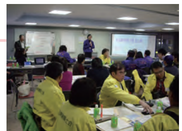
建物や自然、看板などを対象に街なみの色彩調査のウォッチング後、セミナーにて調査発表を行っている様子。

毎年、幅広い年代・分野の方々の参加を得ながら、発見や体感、共有と対話を通して相互理解を深め、参加者がそれぞれの立場で関門景観について考え行動する一歩となる活動を、両市の大学や行政（関門景観協議会）などと連携して行っている。より関門景観への関心を高めてもらうため、平成23年度には、「五感で感じる関門景観・10選」を募集・選定し、ハンドブックを作成、配布したほか、パネル展を開催する等の取り組みも行われている。