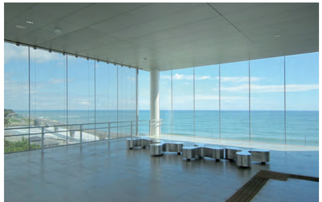
自由通路の東側突当りの展望スペース。視界を遮ることなく海を一望できる。自由通路東側先端からの眺めは圧巻であり、いつでも、人々が滞留している。