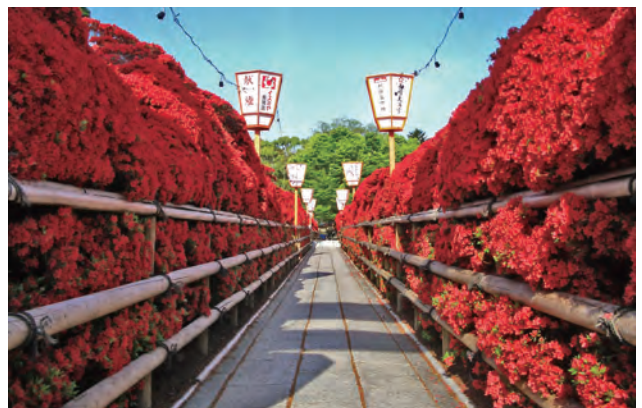
満開の時期のキリシマツツジの群生。樹齢は百数十年と言われ、人の背より高く茂る。現在は市が維持管理を行っている。