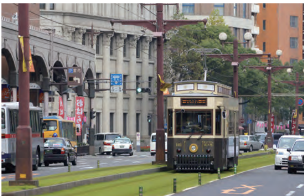
運行 100 周年を記念した観光レトロ電車「かごでん」と軌道敷緑化。本市の貴重な景観、観光資源としての活用を図る。