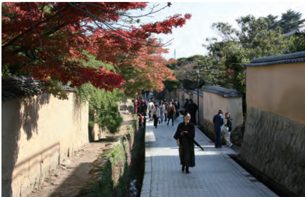
土堀の街なみが美しい古江小路地区。城下町長府の観光名所のひとつとなっている。

城下町長府地区は、古事記や日本書紀にも記された 1800 年の歴史をもつ町である。当該地区は、忌宮神社を中核として町が形成されており、長府藩 5 万石の古い街なみと鎌倉時代の禅宗様形式の国宝の功山寺をはじめとする社寺を残すほか、旧山陽道沿い及び忌宮神社参道に長府商店街が存在する。城に近い場所には武士を置き、外れるに従って軽身の家屋敷を配し、山陽道に沿って町人が住むという城下町としては珍しい配置の町割りが練堀とともに残存し、中世以来の町並みの情緒を今に伝えている。この地区では、平成 4 年から歴史的地区環境整備街路事業がはじまり、平成 6 年に城下町長府まちづくり協議会が設立、平成 7 年には官民一体となった「街づくり協定」が結ばれた。平成 8 年には、「下関市長府地区街なみ環境整備地区デザインマニュアル」を策定し、街並み整備助成事業や市単独の景観まちづくり支援事業により、4 地区及びその周辺地域 51.8ha の広い地域において住宅地や商店街の修景が行われた。結果として、江戸期から昭和までの歴史や伝統、水と緑が織りなす独特の景観を生み出し、菅家長屋門のある古江小路地区や狭い路地の続く横枕小路などでは、往時の風情をそのまま残している。地区では、地元団体を中心にワークショップやクリスマスイベント、地区内を流れる壇具川ホテル保存プロジェクトなど、活発な活動がおこなわれている。また、近年では古民家を再生活用した店舗や飲食店などにも若い世代の出店が出現しており、景観向上による地域活性化効果も出てきており、観光客の増加にも寄与している。さらに、城下町長府景観協議会を設立し、景観協定の締結を目指して活動が始まっていることから、国土交通大臣賞にふさわしいといえる。(池邊)