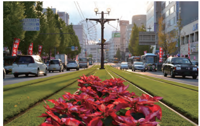
花壇に映えるポインセチアと軌道敷緑化。架空線の市電センターポール化を行い、中央分離帯上の主要な部分にはフラワーポットを設置する等、四季の表情豊かな花と緑の街づくりを推進している。