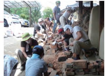
職人さんにハンマーやタガネの使い方を教えてもらい、崩落した窠内から運び出したレンガから土をはつり取っている様子。

仙台市において、建築と子供たちネットワーク仙台（建築・デザイン関係の専門家・行政職員を中心に結成されたNPO）は、未来を担う子どもたちの創造力を培い、よりよい景観まちづくりへの意識の芽を育むための教育活動を実践するため、2001年より仙台を南北に貫く旧奥州街道沿いの歴史的景観資源を保全し、子どもたちの教育に活用する取り組みを継続的に展開している。東日本大震災後は、震災で大きな被害を受けた「堤町まちかど博物館」や「旧丸木商店店蔵」を子どもたちの参画によって再生する活動を中心に取り組んでいる。修復にあたっては、長期にわたり築いてきたネットワークを駆使し、多様な団体と連携して行われた。この震災復興の活動は、震災で少なからず傷ついてしまったみんなの心が元気になっていくことにもつながった。また、これまでの継続的な活動が徐々に実を結び、市内の他の地域からも多くの子どもたちが参加するようになる等、仙台の歴史文化を学ぶ学習拠点として広がりを見せている。