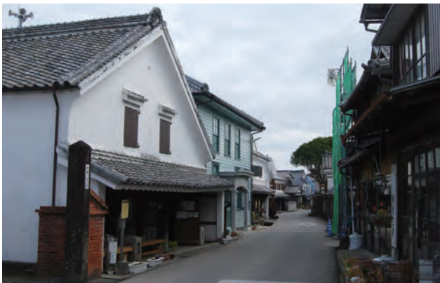
酒蔵通り（旧長崎街道多良海道）。伝建事業での建物の修理や街環事業での道路美装化を行った。手前の白壁土蔵の建物は継場と呼ばれ、現在はまちなみ観光案内所となっている。隣の洋風建築は、旧郵便局で現在地区の公民館として活用されている。