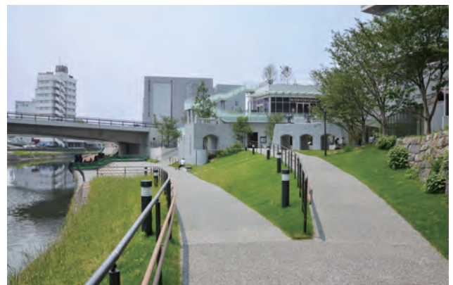
再開発地区(右)から坪井川(左)へとゆるやかに結ぶスロープのある「水辺の景」の拠点となる水辺広場。「水辺の景」:坪井川周辺