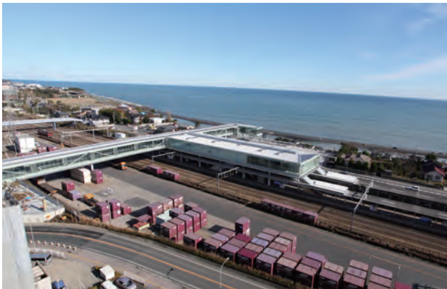
山側と海側をつなぐ自由通路と橋上駅舎。日立の青い海と大きな空。周辺環境になじむよう高さを低く抑え、一体的な空間を創出する。

整備にあたって日立市は、鉄道事業者が事業主体である駅舎の整備と自由通路を始め日立市が行う関連する都市基盤整備及び民間施設誘導等について、一体的で整合のとれたデザインによる景観形成を行い、まちの顔にふさわしい都市空間を実現するため、「デザイン監修者(妹島和世氏)」を位置付けた。デザイン監修者が設計から工事に至るまで全ての事業に関わることにより、建築と土木を融合した連続性、一体感のあるデザインの実現に至った。その結果、単なる通過点であった駅が、多様な交流を育む交流拠点として、訪れた人々の記憶に残り、明日への生きる活力を与える場所となった。