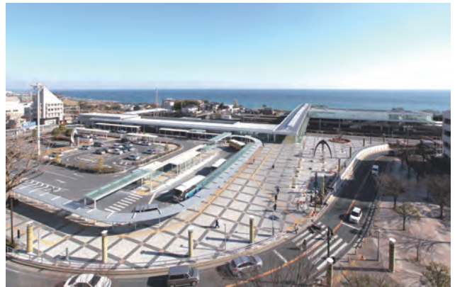
中央口駅前広場より東をみる。施設が連続しまとまりある空間を創る。屋根の高さを揃え、スカイラインを統一するとともに、看板類についても、配置に統一性を持たせる誘導を行った。

今回の申請は鉄道施設と駅前広場の一部など近年整備が実現した部分を対象としたものであったが、今後とも日立市中心駅の都市景観整備として、既設の駅前広場や駅前から出る大通り(平和通り)そしてその周辺の建築物まで含めた取り組み、さらには隣接するシビックセンター地区の都市広場や建築物群との一体感の実現など、本地区での動きがより一層拡大・進展することを期待したい。(岸井)