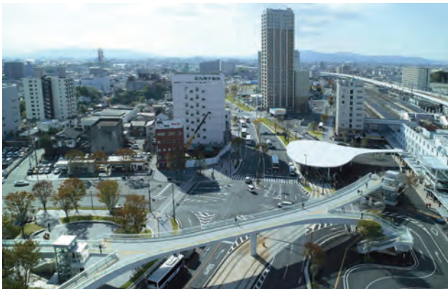
当地区を南方へ望む。熊本駅(右)から交流広場(左下)や木立の景(中央)へ緑が広がる。公園のような駅、駅のような公園とした駅周辺整備。

本計画は、熊本駅周辺の駅前広場、街路、河川などの公共空間を一体的に整備したものである。計画の実施にあたっては、「熊本駅周辺地域都市空間デザイン会議」が組織され、各事業者と市民をつなぎ、きめ細かな調整が行われた。そのプロセスでは 100 回を超えるワーキングが開催され、詳細な調整がおこなわれた。結果として、各空間のデザインレベルは大変高いものとなり、他都市にない特徴的都市空間が形成されている。特に、東西の駅前広場は、照明やサインなどを組み合わせた連続壁面や大屋根を有する個性豊かな場となっている。一般に、駅前広場はバスターミナルとタクシープールがその主体となりがちであるが、巧みな配置計画を行い駅前の印象を一変させている。また、路面電車とのアクセスも良く、駅前広場に連続する街路の緑化と相まって「公園のような駅・駅のような公園」を実現させた。国際的に見てもその質は高く評価されるものと言えるだろう。今回、公共空間は一応の完成を見せたが、今後各街区の建築が進行する中で、都市景観総体としての高い質が継承発展していくことが望まれる。(田中)