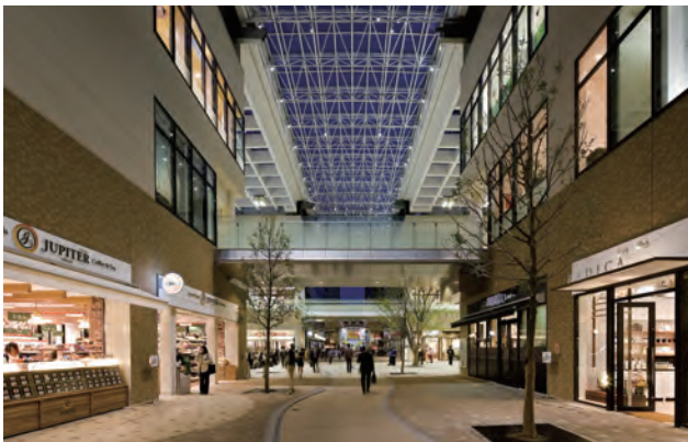
丸亀町グリーンの商店街の様子。シャッターのない店造り、官民による一体的な舗装が特徴。店舗にオーニング（庇）の設置を義務づけ、心地よい環境を演出している。