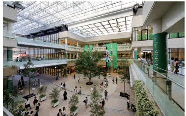
丸亀町グリーンの広場（約 300 坪）。シンボルツリーの植樹、広場、官民（高松市、丸亀町グリーン）による一体的な舗装が特徴。一体的な空間を創出している。