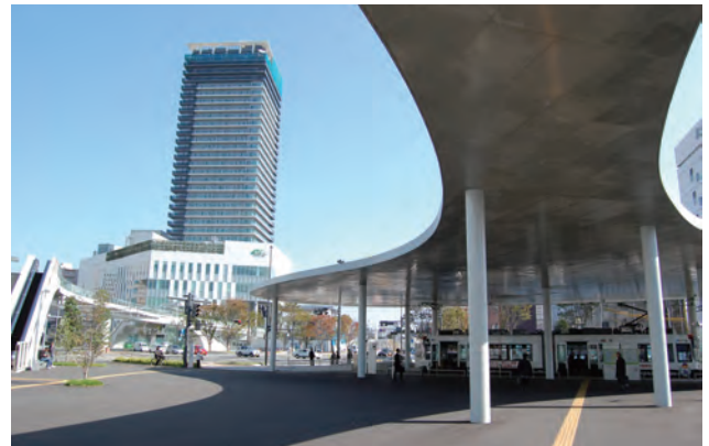
熊本駅から「出会の景」を望む。阿蘇を眺め再開発地区と繋がる駅前の大きなタマリ空間と大屋根(右)。「出会の景」:熊本駅を中心に東西の駅前広場、再開発地区を含み、花岡山・万日山から白川・坪井川を抜け阿蘇を望む