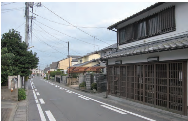
古民家を再生した店舗が建ち並ぶ惣社地区。