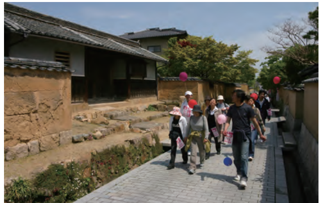
下関市指定文化財「菅家長屋門」と長府地区の象徴である練堀。