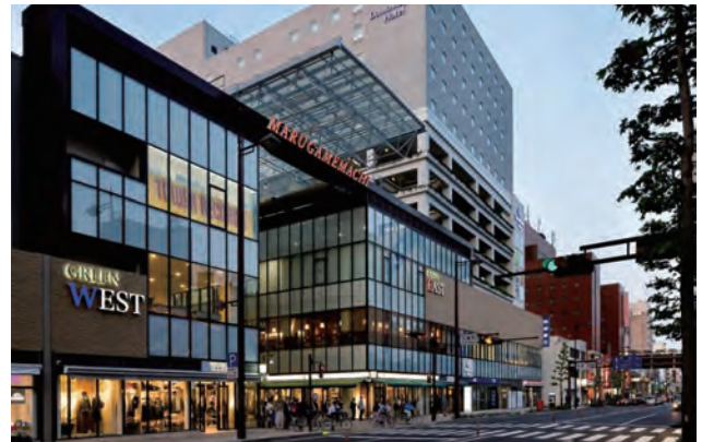
国道 11 号線から丸亀町グリーンを眺める。商店街のアーケード、街路整備、沿道建築物のファサード改修整備がされ、中心市街地としてふさわしい街並みを形成している。