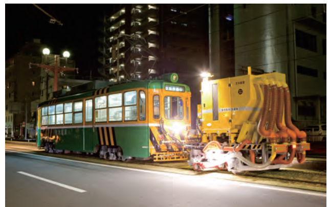
本市が独自に開発した維持管理に活躍する芝刈・散水電車(夜間作業)廃車となった電車を改造して作った芝刈装置を、散水用ノズルやタンクを装備した散水電車が機関車役となって牽引するという、ユニークなアイデアによるものである。