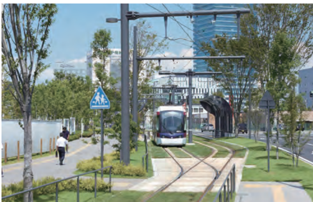
歩道の脇を走るサイドリザーベーション化された路面電車と多様な樹木が重なり合う「木立の景」。「木立の景」:駅前を南北に貫く路面電車通り沿い