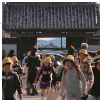
自然・歴史・くらしをつなぎ、誇りと愛着を育む大樹寺から岡崎城への眺望景観（通称：ビスタライン）

本校南門となる「総門」を題材として、各学年の発達段階に応じて教材化し、体験・体感的な活動を中心に据えて実践を行うことで、意識や関心の高揚につなげ、郷土への愛着を深め、地域の一員として今後もビスタラインの景観を守り受け継いでいこうという誇りの醸成を図っている。