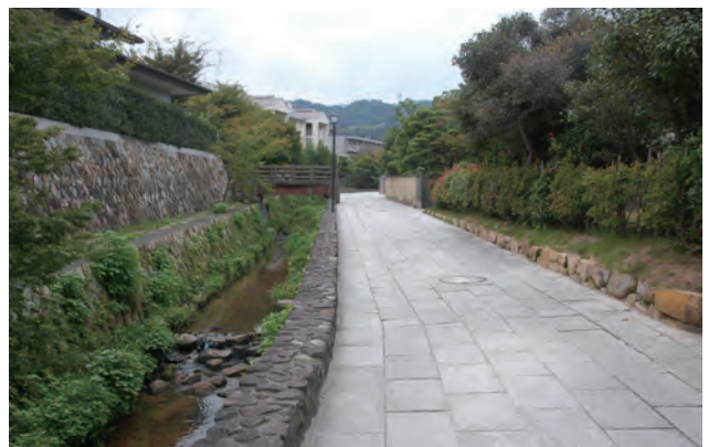
親水性と生活道路としての機能を考慮して整備されている壇具川地区の道路。