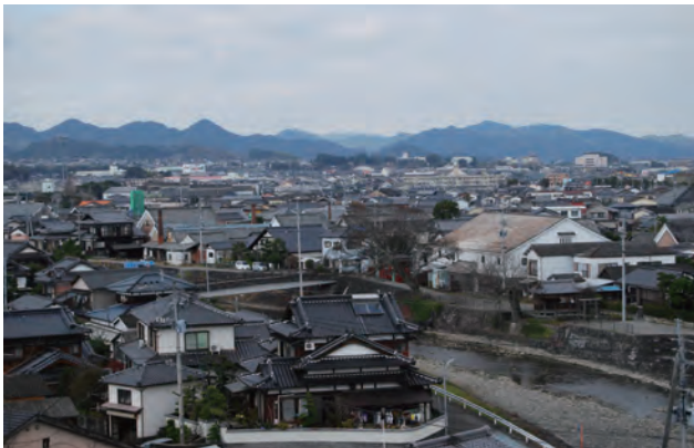
当地区は、浜川沿いに位置する。写真では川の奥（対岸）に旧長崎街道が通る。酒蔵の煙突が建ち並び、独特の景観を形成している。

対象地区は平成 18 年に重要伝統的建造物群保存地区の指定を受け、平成 15 年頃より地元で盛り上がっていた歴史的な街なみを活かした街づくりに邁進してきた。指定地区は浜中町八本木宿地区と浜庄津町浜金屋町地区の 2 地区に分かれており、両地区に伝統的建造物（建築物）は 160 件指定されている。指定から 7 年の間にこのうち 36 件（一部年度に跨がる重複あり）の修復を終えてきた。審査のため現地を訪れたが、修復が終わり歴史的街なみの雰囲気がある箇所と手つかずでそういった趣からは異なる箇所の差は大きい。事前の下調べ時にみた写真から現地は一層整備が進んでいた。いまだ十分ではない道路など公共施設部分の整備や、箇所により異なる整備状況、また結構区間が長いため雰囲気がある箇所は限定的であるなど、都市景観大賞の受賞地区であると聞いて訪れた人は、ここが受賞地区なのかと疑問を持たれる場所も未だ多く残っている。しかし数年でここまで持ってきた意欲、努力は評価できる。このため、引き続きスピーディに整備が進められ、数年の内に対象地区の多くの場所で良好な景観が作られることを期待して、特別賞として表彰することとしたものである。（高見）