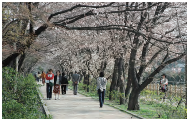
八条ヶ池は、一年を通じて市民の憩いの場・交流の場であり、人気の散歩コースとなっている。