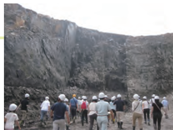
炭鉱遺産バスツアーの開催：現在も採炭されている露天掘り現場を見学し、その石炭を燃料とした発電所を見学している様子。

このような状況に対して、NPO 法人「炭鉱の記憶推進事業団」は 2007（平成 19）年に設立され、岩見沢駅前の「そらち炭鉱の記憶マネジメントセンター」を拠点に、「炭鉱遺産を舞台にしたアートプロジェクト」、「次世代へ伝える、子どもワークショップ」、「幌内線での線路の灯りプロジェクト」、「炭鉱の記憶フットパスマップの作成」等、様々な地域資産の普及啓発活動を実施してきている。その結果、近年は元炭鉱マンが学生のツアーガイドをしたり、当時の炭鉱の様子を模型で再現するなど活発に活動し、地域の誇りやコミュニティの再生の糸口が見え始めている。負の遺産ともいわれる「炭鉱都市」は、これまで景観の対象とされてこなかったが、私達日本人の貴重な生活の景観歴史資産として評価すべき時期に来ている。今後の保存と活用の展開を多いに期待したい。（卯月）