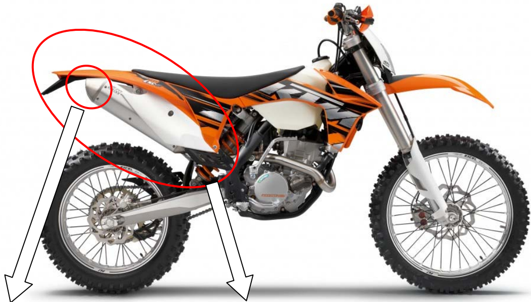
(消音器エンドキャップ)