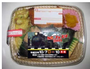
サークルKサンクス 「SLフェスタ記念弁当」 静岡県内全域(350店舗)で発売