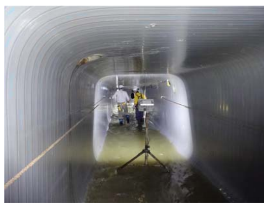
下水道管きょ内の状況