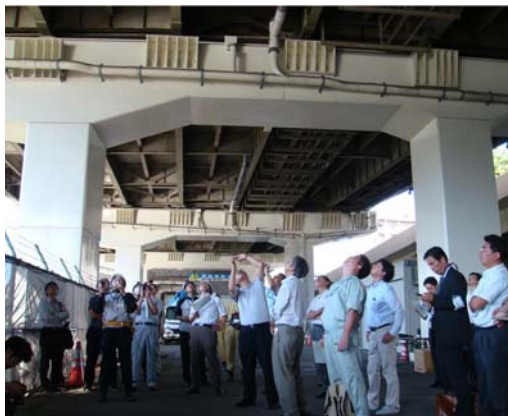
視察の状況（桁下より）

首都高速における高架橋床版裏側のコンクリート劣化状況、補修・補強工事について視察