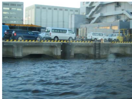
視察現場（大井食品埠頭）の状況