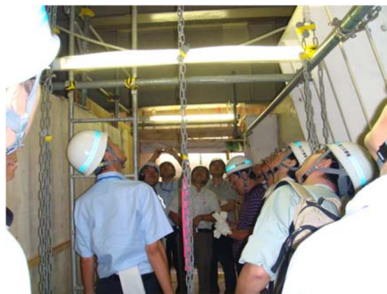
視察の状況（吊足場より）