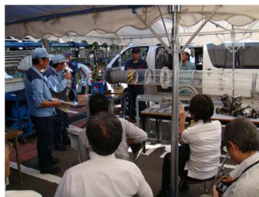
SPR工法のデモンストレーション