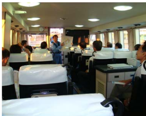
視察の状況（船上から）