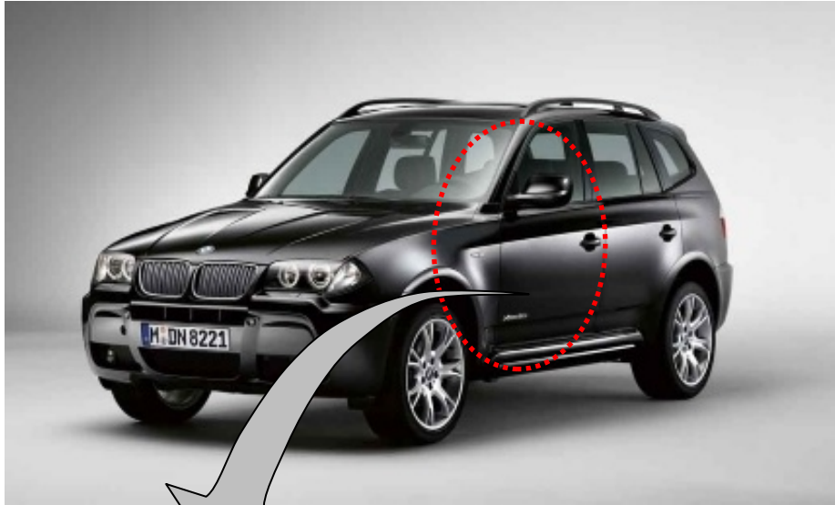
左ハンドル車で説明