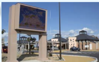
LED パネルの電光掲示板。「さぬきうどん名刺ケース」は本物みたい!