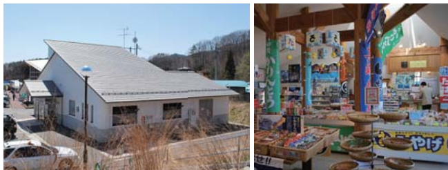
上 / 「道の駅 たろう」。下左 / 隣接する「たろう津波防災・道路情報館」。下右 / 店内の様子。現在は他県の「道の駅」で取り扱っている産品が中心。