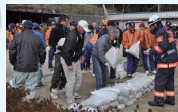
毎年行われている防災訓練。農家の素朴なおもてなし「じゃがいもまんじゅう」。