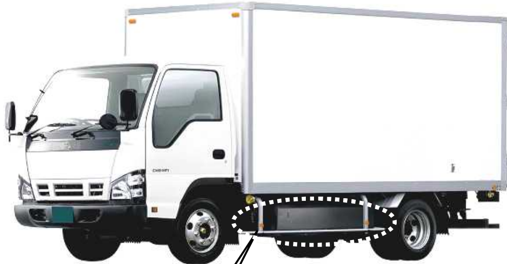
燃料タンク取付け部断面