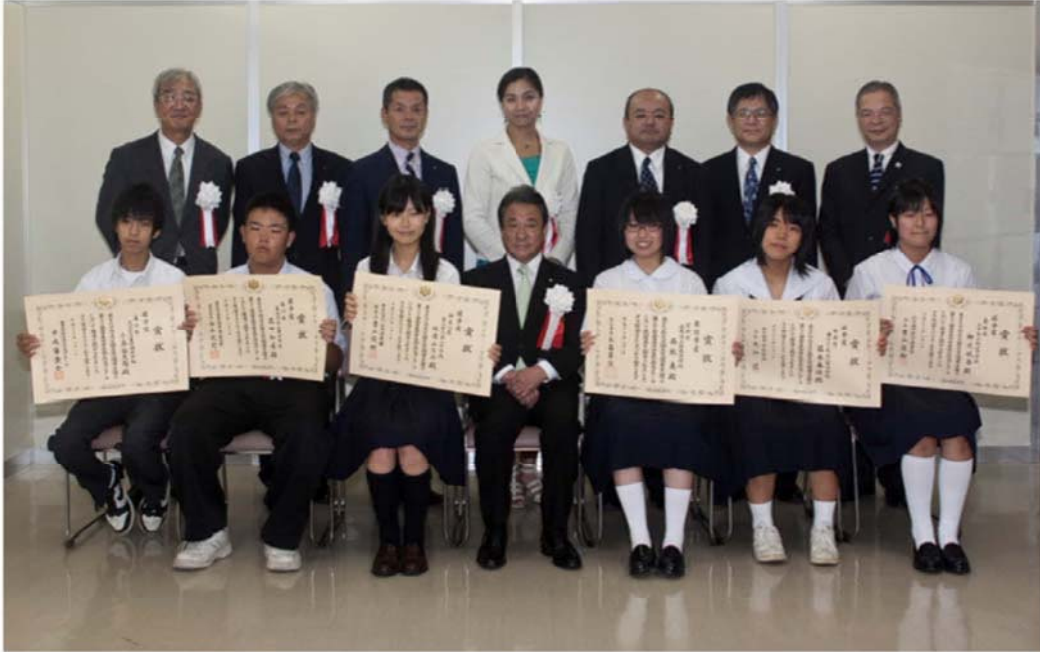
三井 辨雄 国土交通副大臣を囲んで記念撮影

全国からの応募作品19,618編の中から選ばれた最優秀賞1編と優秀賞5編の受賞者の表彰式は、平成23年8月1日（月）に科学技術館サイエンスホールにて開催された第35回水の週間水を考えるつどいにおいて実施されました。